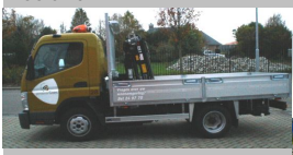
Openlaadbak met overbouw van Hiab kraan voor de gemeente Goes