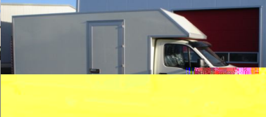
Smartbox openlaadbak voor Bluekens Oosterhout