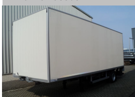
BE Smart oplegger aan Holland banden.