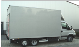
Smart-Box met 750+ systeem aan Adexpo

Carrosserie SMART BOX VAKDAGEN WWW.SMART-BOX.NU