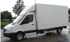
Smart-Box met deuren voor Sturm auto