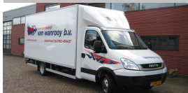
Gesloten Smartbox aan van Wanooy Transport.