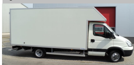
Smart-Box met kopspeel voor Kwakernaak