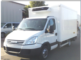
Lichtgewicht koelvries carrosserie met laadklep en zijdeur voor Deba met 500kg laadvermogen.