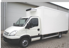
Koelvries carrosserie met laadklep, zijdeur en verplaatsbaar tussenschot voor van Hekken koeriers.