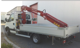
Openlaadbak met radiografische bediende Amco-Veba 906 S4 op een Iveco voor LC Gevelrenovatie.