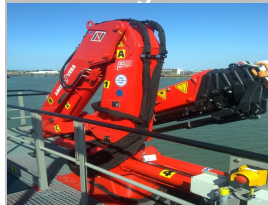
Amco-Veba 823 5S FM met vier hydraulische lieren geleverd aan Delmeco tbv het tanken van zeeschepen.