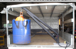
Eigenbouw kraan voor de firma Openneer olie.