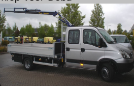
Een driezijdige kipper met Amco-Veba autolaadkraan