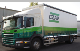
Voor de CZAV de tweede zeilenopbouw met kooi-aap constructie.