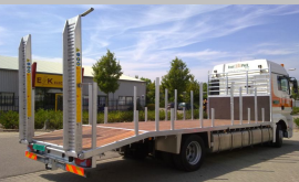
Een complete oprijwagen voor Fruit Tuin Park.