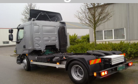
Een trekkerombouw op basis van een Volvo FL