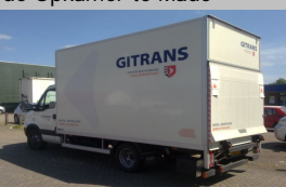
Voor Gitrans een gesloten SMARTBOX