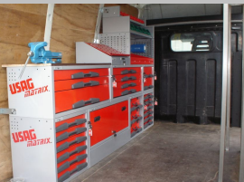
Voor de Gemeente Hulst een USAG bus inrichting.