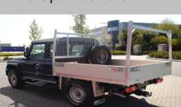
Openlaadbak met palenjuk in opdracht van Deba