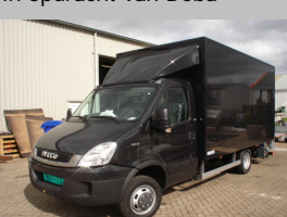
Gesloten SMARTBOX voor de Opkamer te Made