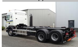
VDL 25 ton haakarm voor Bosman transport te Nisse