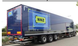
3 assige plywood oplegger voor NNZ verpakkingen