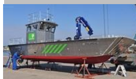
Amco-Veba 603 T3S voor Maaskant shipyards