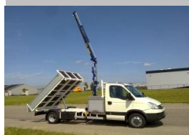
3 zijde kipper met Amco-Veba 103 2S voor de gemeente Vlissingen