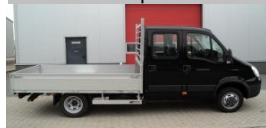
Eigenbouw openlaadbak aan Koko holidays