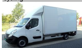
Gesloten Smart-Box voor Renault trucks Hilvarenbeek