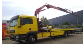
Bergingsvoertuig met Amco-Veba autolaadkraan voor Garage van Hoek