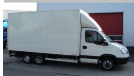
Gesloten Smart-Box op 750+ systeem voor Bluekens Oosterhout