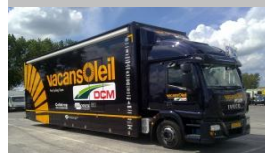
Ondersteuning en service truck t.b.v. STL pro cycling